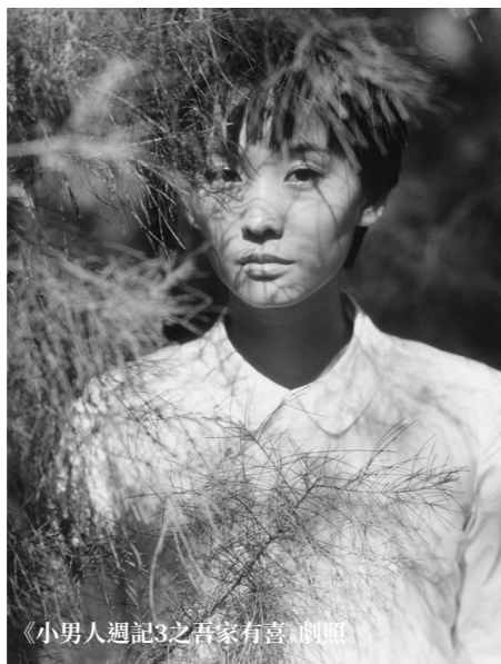
《小男人週記3之吾家有喜》劇照